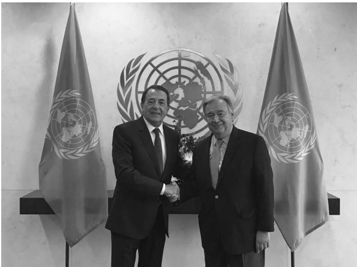
The Secretaries-General of the UN and the SI

SI President George Papandreou gave thanks to António Guterres, and expressed that his election had brought a new spirit to the UN, creating hope at a dif-