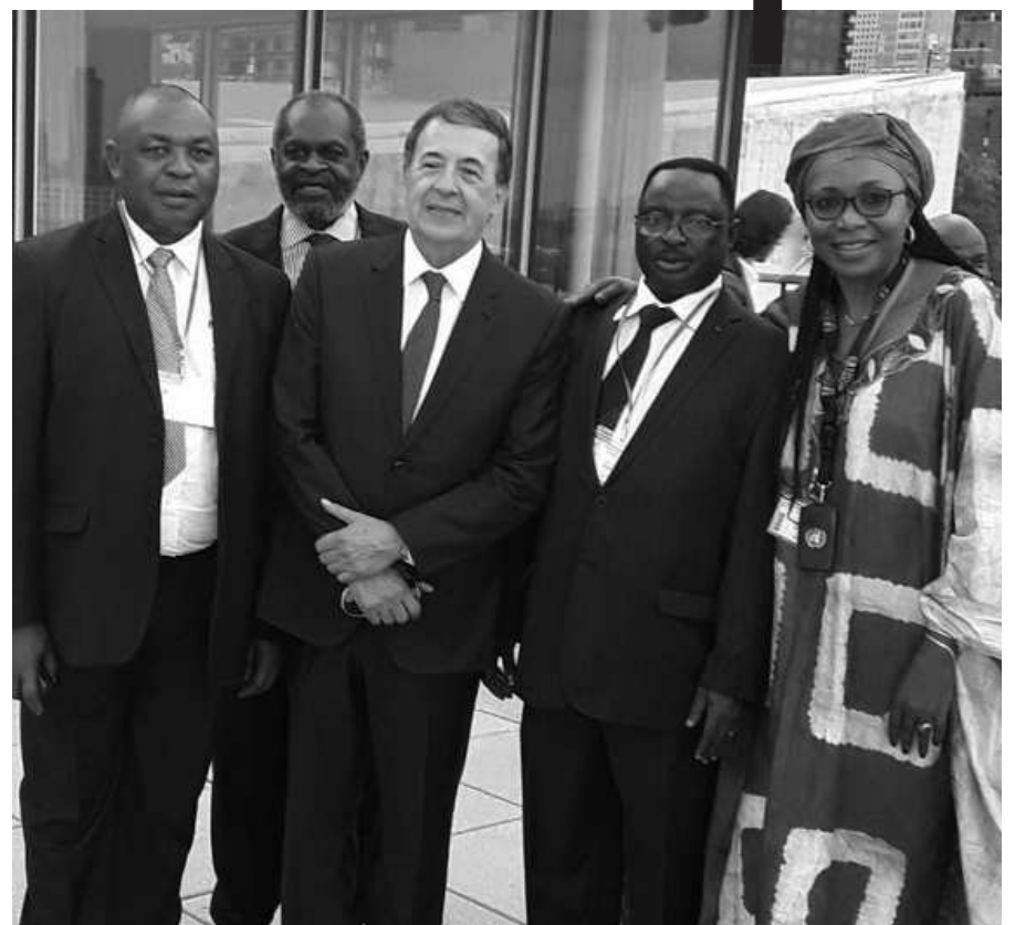
SDF delegation at the SI Council meeting at the UN Headquarters in the company of the Secretary-General of the Socialist International